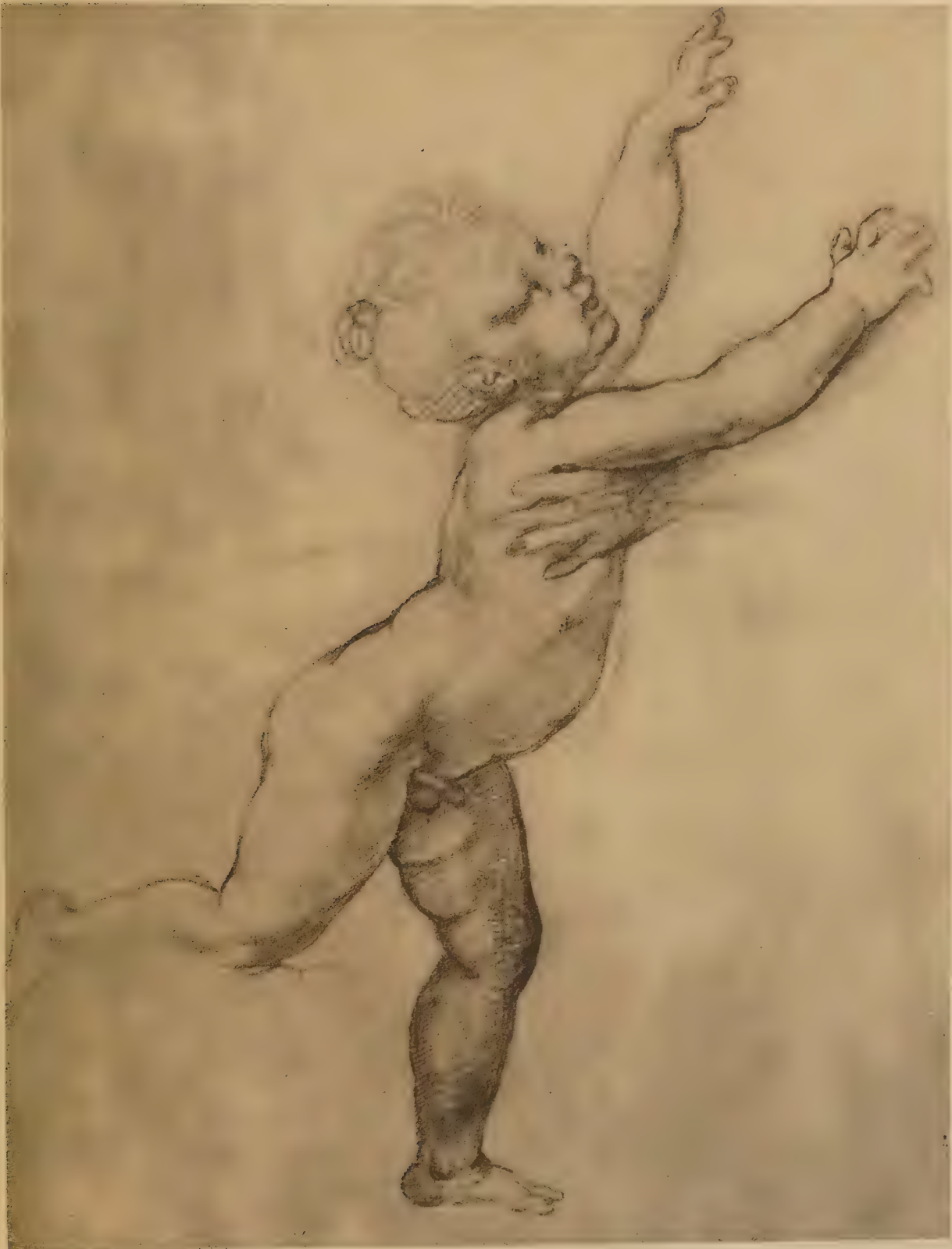
Etude pour l'Enfant de la Vierge de François I er